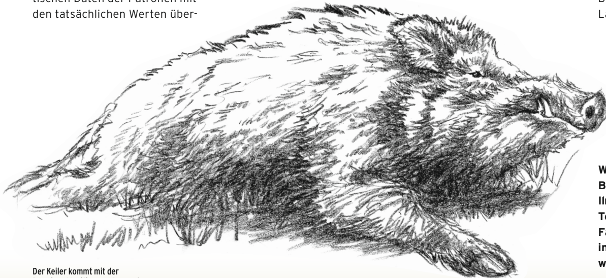
Der Keiler kommt mit der Premium-Munition von Brenneke zur Strecke.