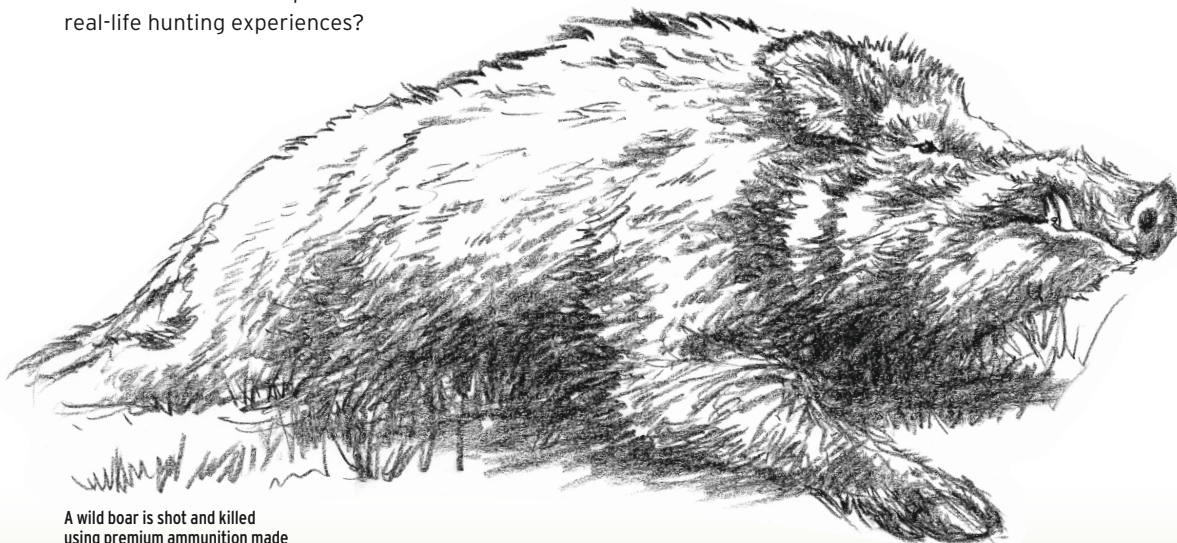
A wild boar is shot and killed using premium ammunition made by Brenneke.